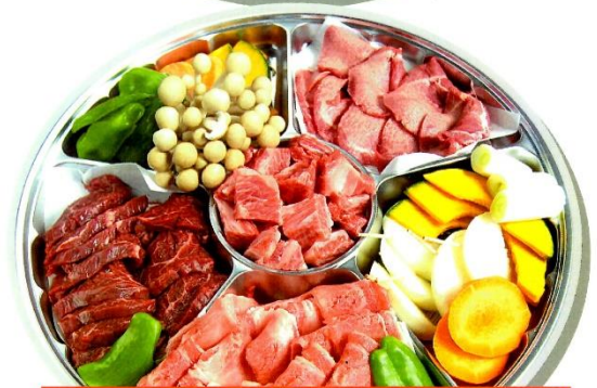
牛焼肉Bセット 6,200円 (税込) (上カルビ、ハラミ、落し角切りカルビ、牛タン、野菜) 各180g