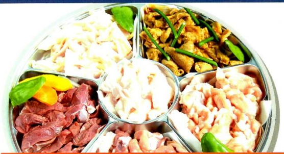
ホルモン焼肉セット 4,800円 (税込) (牛ホルモン、牛ギアラ、牛ミノ、鶏ナンコツ、豚ハラミ、豚やわらかもつ) 各180g