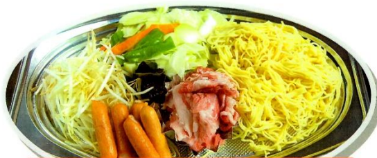
焼きそばセット 2,000円 (税込) (焼きそば3玉、豚小間、ウインナー5本、野菜) 300g