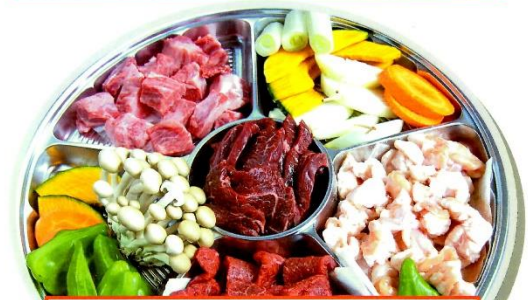
牛焼肉Cセット 5,000円 (税込) (牛ホルモン、赤身モモ、ハラミ、角切カルビ、野菜) 各180g