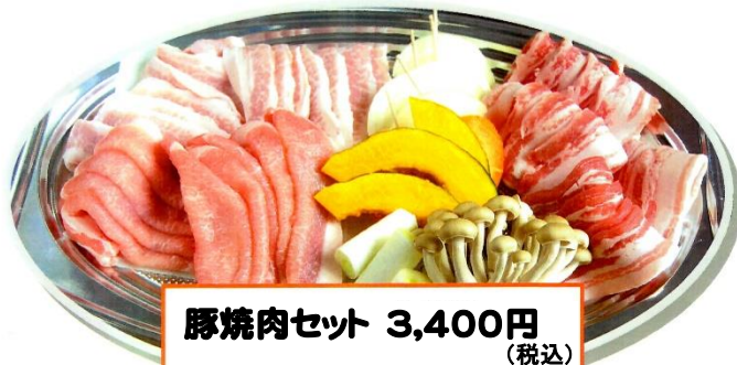
豚焼肉セット 3,400円 (税込) (豚バラ、ロース、トロ、野菜) 各180g